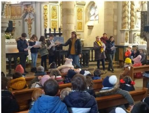
École Notre Dame de Bodilis