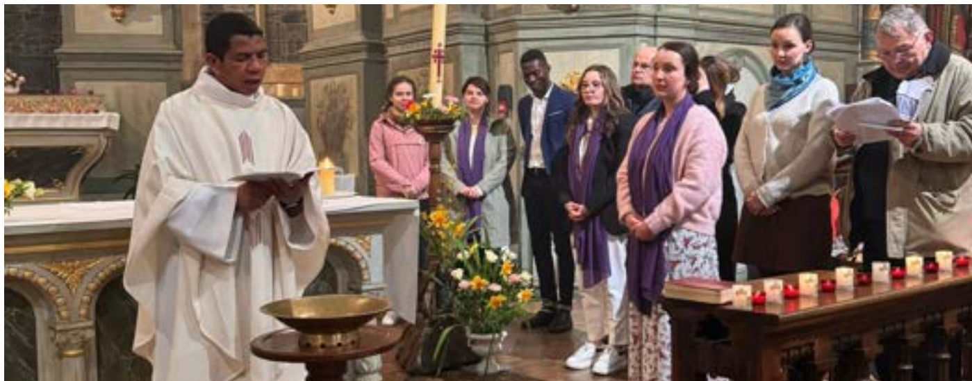
Baptêmes - Vigile pascale - Dirinon 2024